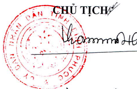
Trần Tuệ Hiền